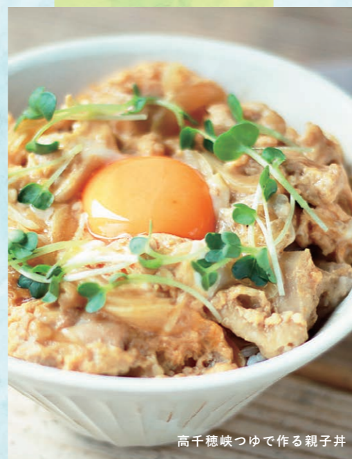
高千穂峡つゆで作る親子丼